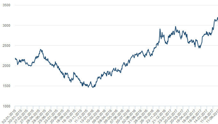
Zinkpreisentwicklung seit Anfang 2015