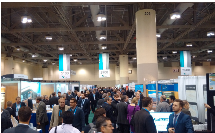
PDAC 2016