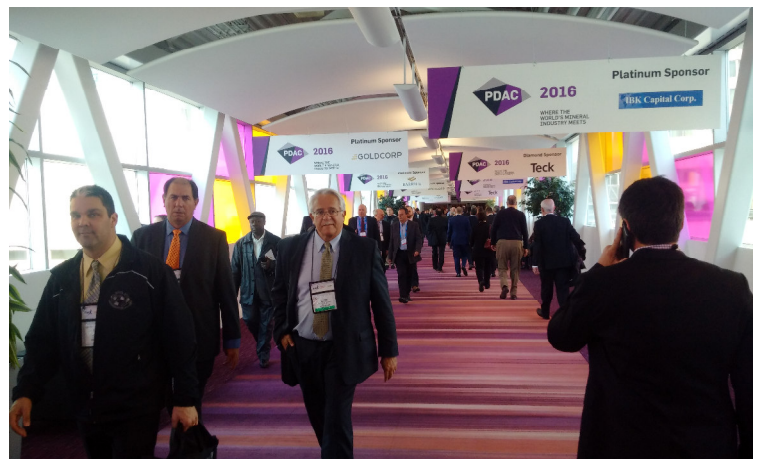
PDAC 2016

Die Aktie von AuRico Metals sah in den letzten Handelstagen eine hohe Volatilität. In der Spitze ging es bis auf 0,75 CAD rauf, ehe wir gestern beim Tagestief von 0,68 CAD schlossen. Wie in Ausgabe 157 ausführlich erörtert, wartet der Markt auf die Veröffentlichung der Ressourcenstudie und